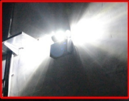
Parıldayan ,3 spotlu ürünün önden görünüşü